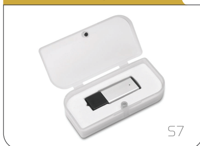
Custodia in plastica frosted